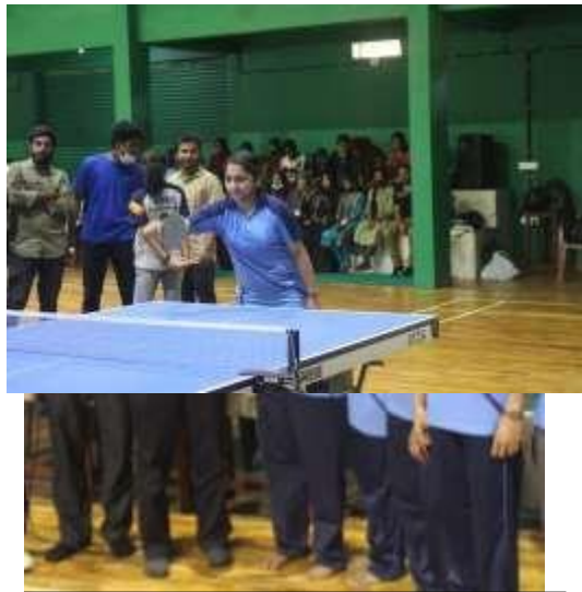
2 nd prize table tennis women