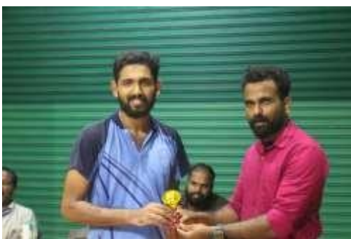
2 nd prize badminton men