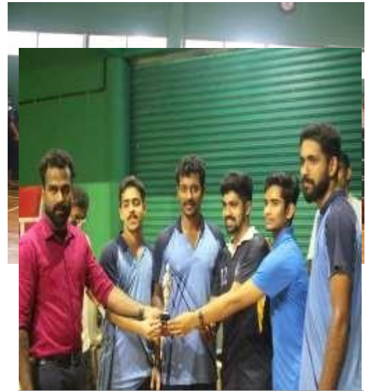
2 nd prize table tennis men